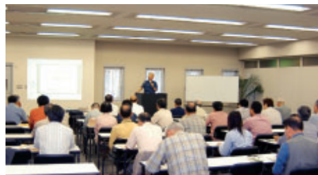
日専連ビルでのサテライトキャンパス

青森市・山形市での開催を経て、今年は十一月十日（土）に福島市（福島ビューホテル）で開催する予定です。これは地域社会と連携を深めながら学習機会を宮城県以外にも広めようと企画されたもので、テーマも歴史・経済・教養・健康と多彩で文化講演会にふさわしい内容になっています。詳細については、東北学院大学総務課 022(264)6412 にお問い合わせ下さい。