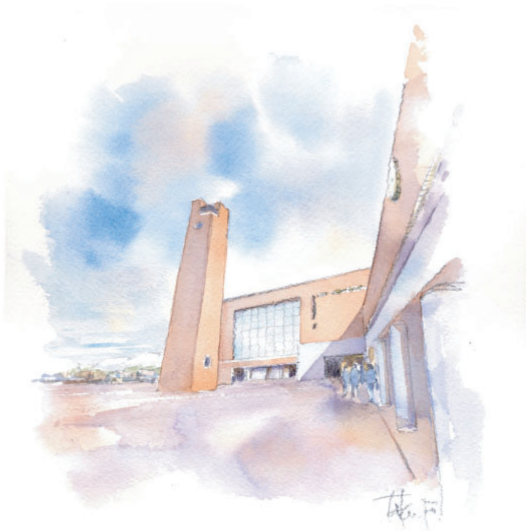
TOHOKU GAKUIN HIGH SCHOOL