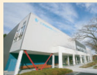
工学基礎教育センター

2006年4月に工学部教育棟の中心的施設として設置。数学や物理を徹底的に指導しながら基礎学力の向上を目指す。