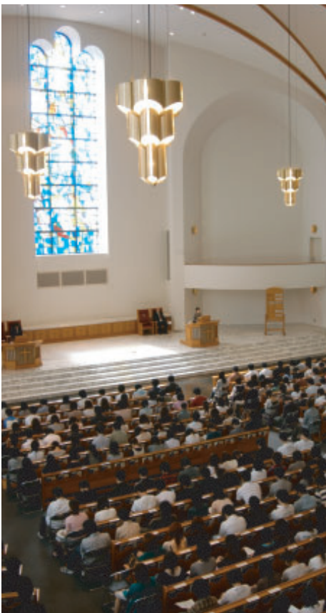
泉キャンパス礼拝堂での礼拝

近年「いじめ」による自殺が大きな社会問題になっていますが、東北学院は創立以来キリスト教精神を基に「心を育てる教育」を行っています。たとえ学力や知性が優れていても、人間としてモラルに欠けるようなことがあつてはならないと考えているからです。なかでも建学の精神を具現化している毎朝の礼拝は、短い時間ではありますが、聖書のことばを聞き、荘厳なパイオルガンの音色に包まれて自分を見つめることができる絶好の場となっています。大学の教育として専門的知識と高度な技術を授けることはもちろん、東北学院大学がこれまで若い人の心を育てる教育を熱心に行ってきたことに「東北学院大学の卒業生は信頼できる」と地域社会から評価されている所以かもしれません。