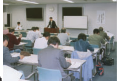
本学を会場とした公開講座