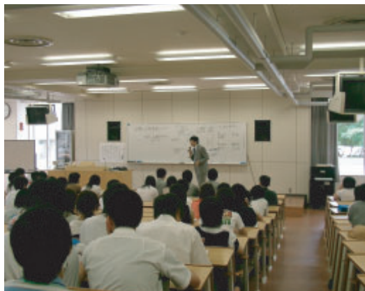
オープンキャンパスでの模擬授業