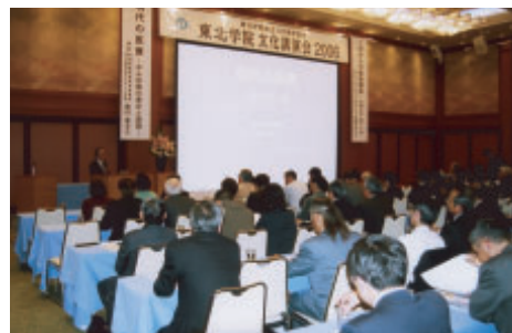
山形で開催した東北学院文化講演会