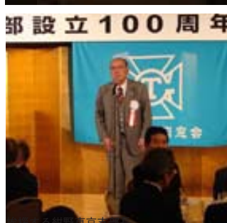
挨拶する紺野東京支部長