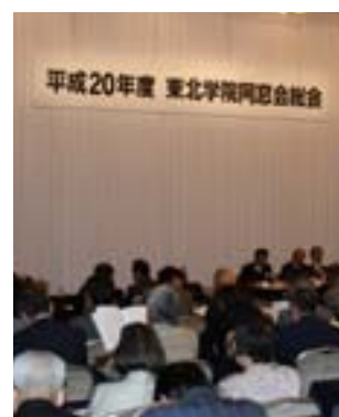
5月15日開催の同窓会総会