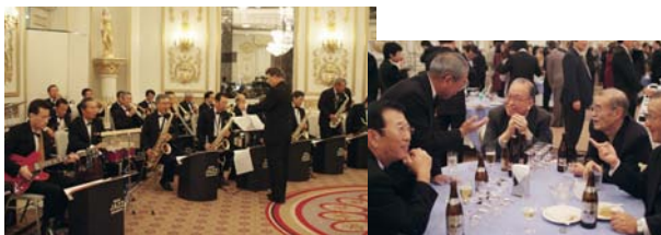
モッシージャズオーケストラ

時間：17：00～19：00 場所：江陽グランドホテル 仙台地下鉄「広瀬通駅」西-1出口前 会費：①女性及び20代の参加者 3,000円 （※事前申込者のみ適用となります） ②30代以上の男性及び当日受付者 5,000円