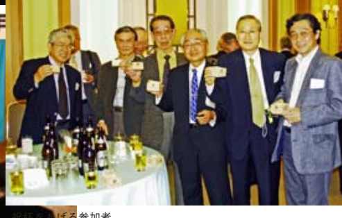
祝杯をあげる参加者

一九〇八（明治四十二）年三月に東北学院同窓会の最初の支部として設立された東京支部は今春支部設立二〇〇周年を迎え、去る三月二十二日（土）にハイアットリージェンシー東京において三百名を越す同窓生が集い東京支部設立二〇〇周年記念祝賀会が開催された。この記念祝賀会を開催するにあたり、東京支部では昨年四月に東京支部設立一〇〇周年記念祝賀会実行委員会を組織し、本番まで七回にわたり詳細な打ち合わせを行って準備を進めてきた。当日は東京支部の慶事を