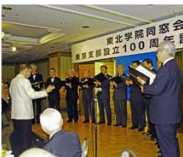
グリークラブ東京OB合唱団

そして、グリークラブ東京OB合唱団が宮城県民謡の斎太郎節を歌いだすと会場の彼方此方から歌声が上がりました、東京支部の設立二〇〇周年を祝っていた。