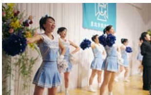
チアリーディングチームによる応援歌披露