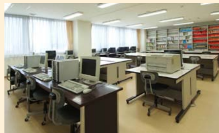
榴ヶ岡高校 管理棟進路指導部