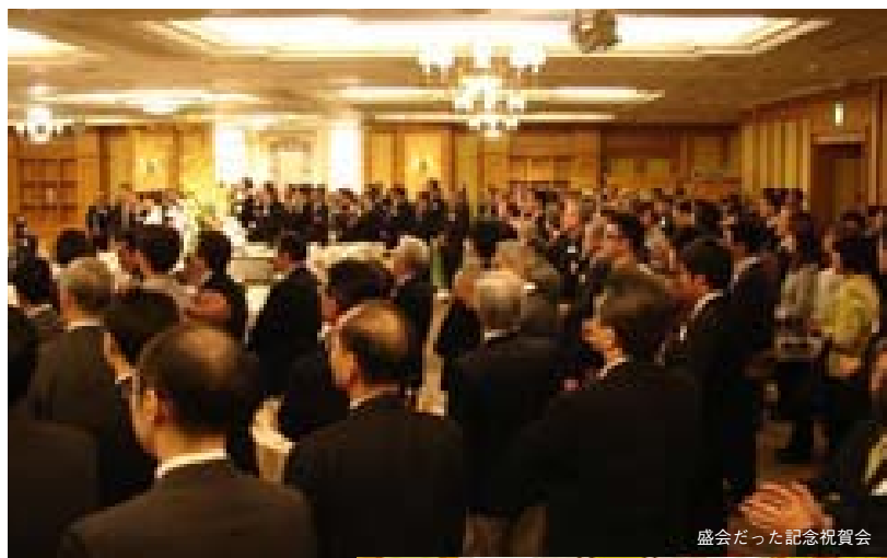
盛会だった記念祝賀会