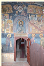
ヤシュニャ修道院 洗礼者ヨハネ聖堂 1583年 2009年撮影

セルビアの16世紀ポスト・ビザンティンの修道院聖堂の壁画から取りました。洗礼者ヨハネを飾る枠です。背景は高価なラピスラズリの青色です。青地は金地について天国と永遠を表す背景として使用されました。粗悪な青色の顔料を使うと、のちに黒く変色してしましますが、元は青色でした。